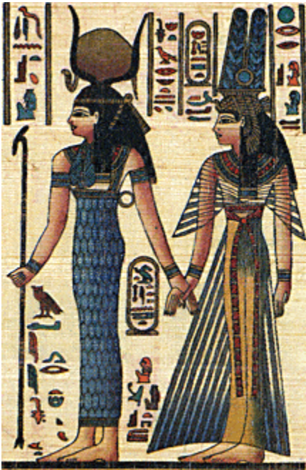
Озирис и Изида

Божествената кръвна линия трябва да се запази чиста