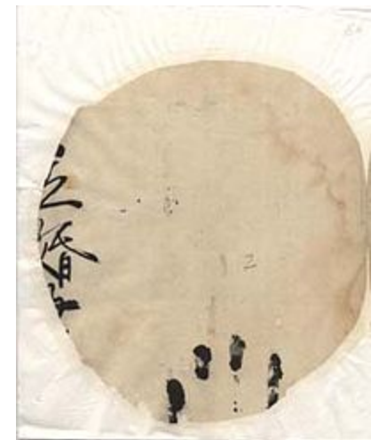
Брачно свидетелство за Шин-пуа („малка снаха“) XIV-XVII в.